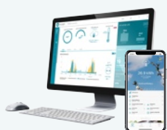
Suite logiciel MyLight Systems